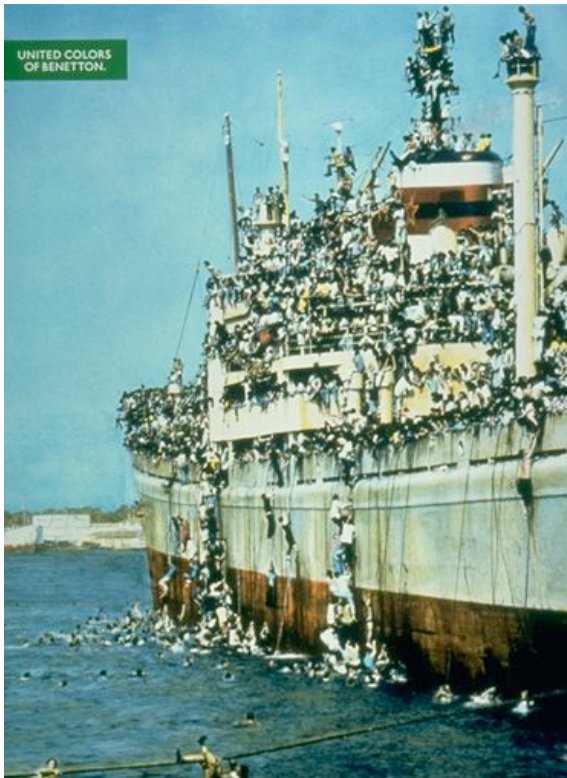
Pubblicità Benetton 1992 incorporante foto ANSA di sbarco di albanesi a Bari agosto 1991

Lo scopo della mostra non è solo quello di presentare alcuni importanti documenti fotografici e audiovisivi di luoghi marginali e liminali e delle persone che ci hanno vissuto. Essa vuole invitare anche e soprattutto a una riflessione critica sui 'modi di vedere': sullo sguardo di chi ha fotografato e filmato questi luoghi, sui processi stessi di rappresentazione. Vorrebbe comprendere se queste immagini hanno contribuito, a loro volta, alla creazione e alla riproduzione di idee di marginalità, subalternità ed esclusione sociale o se invece hanno avuto, rispetto ad esse, una funzione di critica o contestazione.