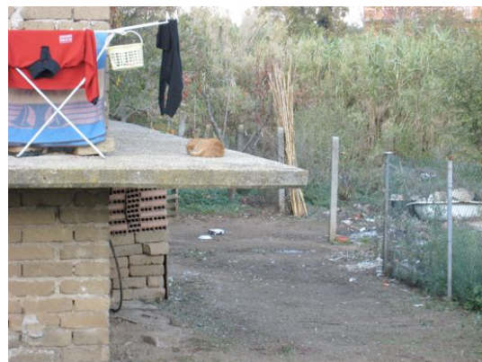
Abitazione di famiglia rumena, Quartiere Borghesiana, Roma, 2007