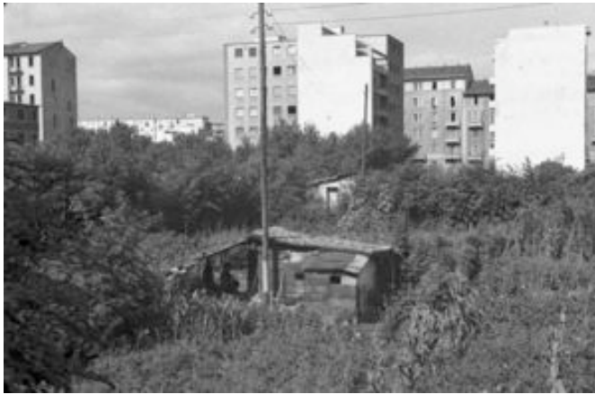
Federico Patellani Baracca, periferia di Milano 1946

Inaugurazione: venerdì 25 giugno 2010, ore 18.30-20.00 fino al 9 luglio 2010, lunedì-sabato, ore 16.30-19.00 Ingresso libero