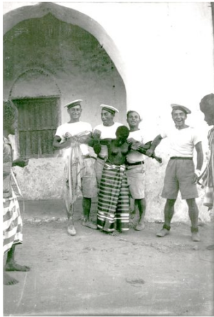
Marinai italiani con donna eritrea, Massaua, 1936